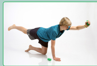
Core Special mit Brasil® Mini Moves Core special with Brasil® mini moves