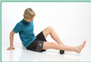
Faszienmassage mit Eigengewicht Fascia massage with own body weight