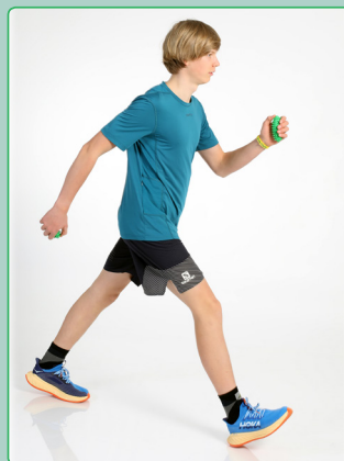
Brasil® Tiefenmuskeltrainer Brasil® deep muscle trainer