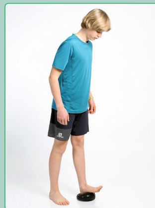
Dehnübung auf dem Igel Stretching exercise on the hedgehog