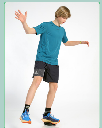
Balance und Stabi Übung (auch mit Schuhen) Balance and stability exercise (also with shoes)