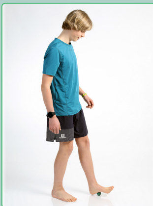
Selbstmassage der Plantarfascie Self-massage of the plantar fascia