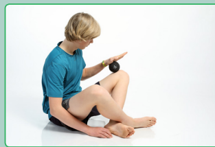
Oberschenkelmassage mit Actiball® Upper thigh massage